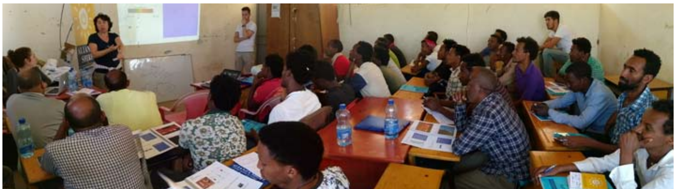
Sesión de formación teórica.