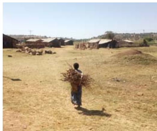
Mujer cargando leña en el campo de Adi-Harush.