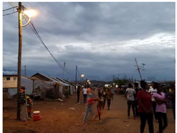
Campo de Adi-Harush con alumbrado público.