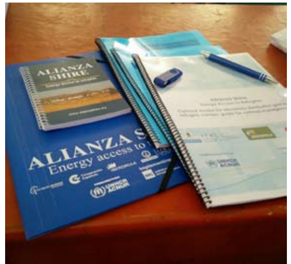
“Toolkit” de formación.

Con el fin de sentar las bases teóricas que residen tras la tecnología a implantar, en diciembre de 2016 expertos de Philips Lighting e Iberdrola impartieron clases teóricas a un grupo de 28 personas. Este grupo estaba formado por refugiados, miembros de la comunidad de acogida, así como personal de ARRA, de NRC y de la compañía eléctrica.