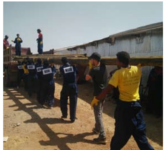
Transporte de postes de madera para la extensión de la red eléctrica.