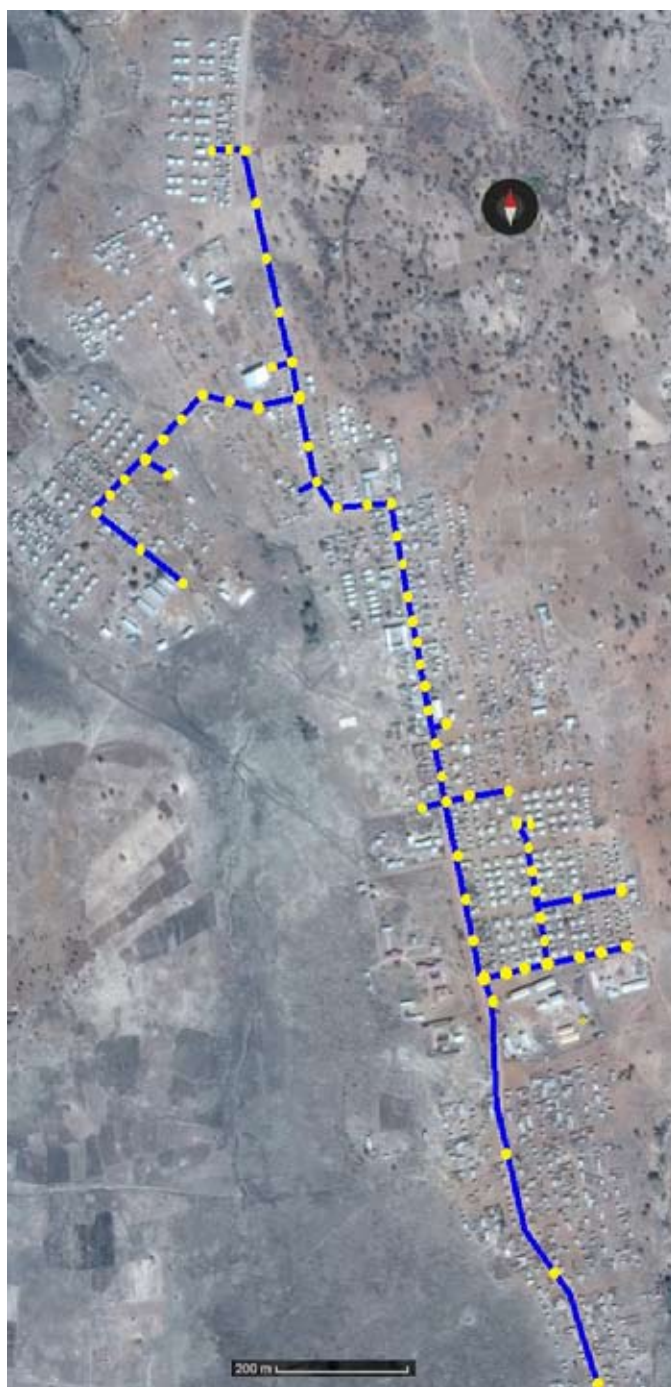
Ubicación de la red de alumbrado público y los puntos de luz instalados.

PARADIGMA. Visibilización de la energía como uno de los principales problemas a resolver en contextos humanitarios. El acceso a la energía se plantea como una cuestión crucial para la provisión de servicios básicos como educación, salud o protección de una manera más eficaz y sostenible. La Alianza también supone una forma nueva de afrontar retos importantes de la sostenibilidad.