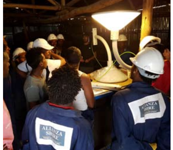
Sesión de formación práctica con luminarias.

Además, en las tareas de instalación también prestaron su apoyo personal de la compañía eléctrica etíope y un refugiado que trabaja como técnico electricista para ARRA. Todas las actividades fueron supervisadas y dirigidas por personal de Iberdrola y Philips, apoyados en la coordinación por personal del itdUPM.