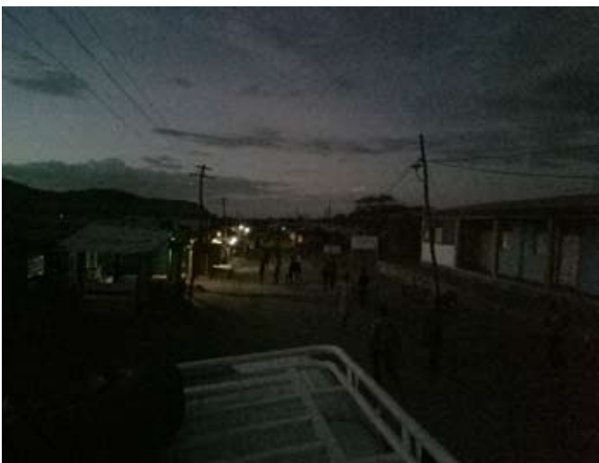
Campo de Adi-Harush sin alumbrado público.

El proyecto piloto contribuirá a mejorar los medios de vida de los participantes en la formación. Por un lado, cuatro de ellos trabajarán para NRC en el mantenimiento de las instalaciones con un contrato de tres años, recibiendo los incentivos estipulados según ACNUR para empleos cualificados. Por otro lado, el resto de participantes en la formación podrán crear un negocio relacionado con la electricidad en los mercados de NRC. Por último, la instalación de alumbrado público permitirá la realización de actividades productivas un mayor número de horas al día [3].