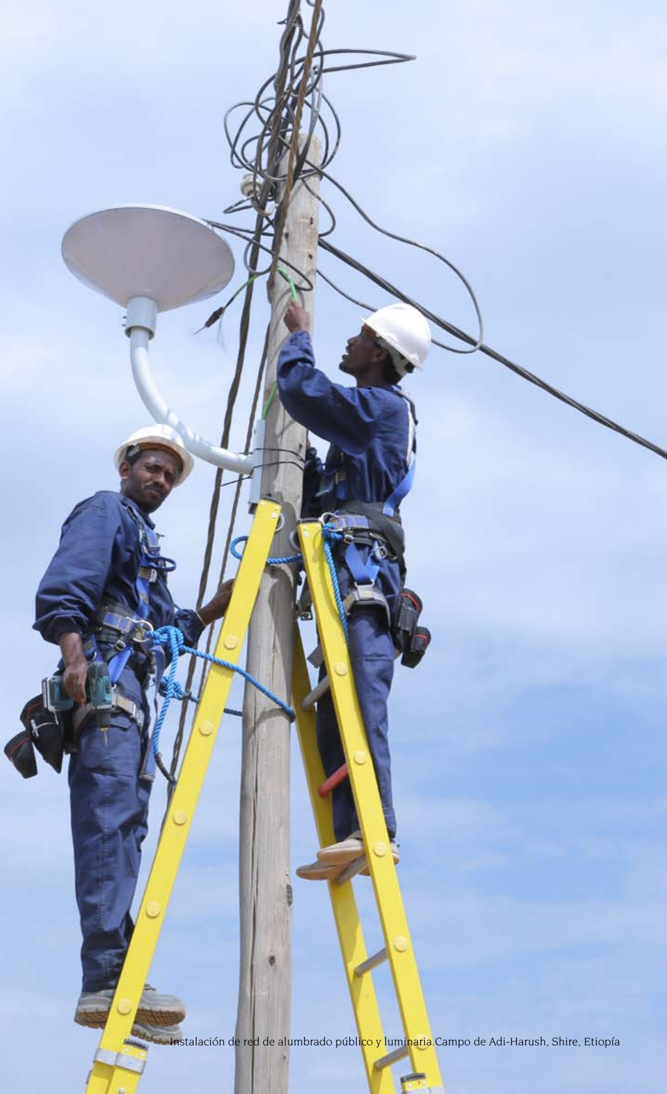
Instalación de red de alumbrado público y luminaria. Campo de Adi-Harush, Shire, Etiopía