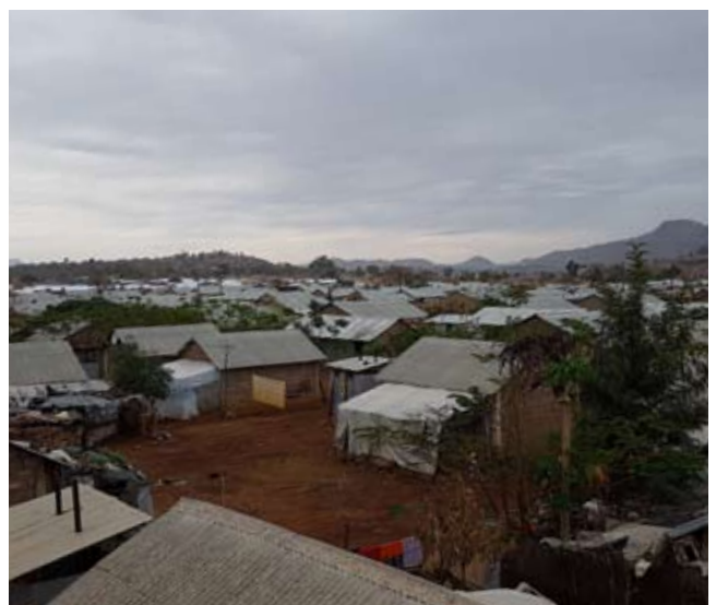
Vista del campo de Adi-Harush.

Podemos calificar el acceso a la energía en campos de refugiados como un problema complejo que difícilmente puede ser resuelto a través de un enfoque tradicional, mediante proyectos o intervenciones puntuales, y que necesita una propuesta innovadora que aúne a actores de diferente naturaleza (públicos, privados y sociedad civil) y con diferentes habilidades (recursos, conocimientos, experiencia...) para dar una respuesta adecuada, integradora y sostenible en el tiempo.