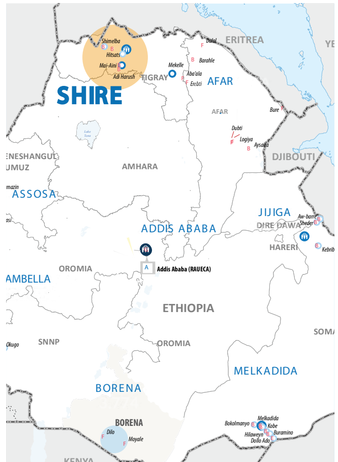
Mapa de campos de refugiados de Etiopía.

La presencia del principal organismo a nivel internacional relacionado con las personas refugiadas y desplazadas, ACNUR, junto con la constatación de que la Alianza es capaz de proveer servicios energéticos sostenibles e innovadores, la extensión a otros campos de refugiados en el mundo es una posibilidad que se quiere explorar.